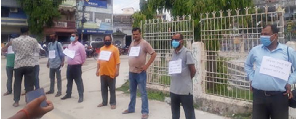
दैनिक समाचारदाता राजविराज, २१ असार ।

प्रदेश २ मा पारित भएको संचार सम्बन्धी विधेयक निरंकुश शैलीको भएको भन्दै राजविराजमा आइतबार संचारकर्मीहरुले प्रदर्शन गरेका छन् ।