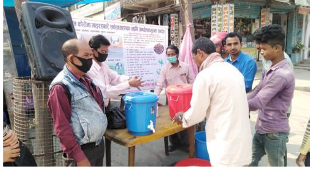
दैनिक समाचारदाता राजविराज, ९ चैत ।