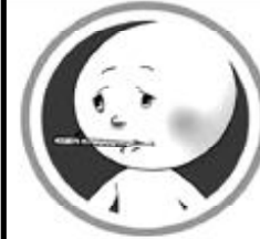
ज्वरो (१००.४°F भन्दा माथि)