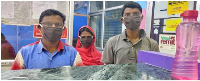
दैनिक समाचारदाता राजविराज, ९ चैत ।

कोरोना भाइरसको संक्रमणबाट जोगिन नेपाल सहकारी संस्था लिमिटेड