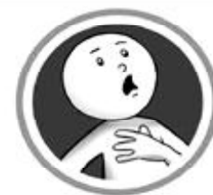
ध्वास प्रध्वासमा अत्याधिक समस्या