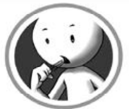
रुघा र खोकी

“नोवेल कोरोना भाइरस प्रभावित देशहरूबाट आउने मानिसहरूमा दुई हप्ता भित्र रुघाखोकी लागेमा, ज्वरो आएमा, घाँटी/टाउको दुखेमा, ध्वासप्रध्वासमा अत्याधिक समस्या भएमा तुरुन्त नजिकको स्वास्थ्य संस्थामा सम्पर्क गर्ने ।”