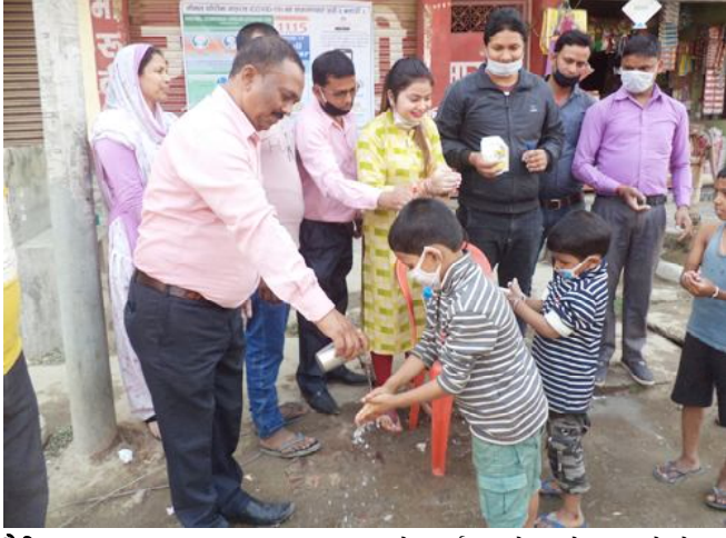
दैनिक समाचारदाता राजविराज, ९ चैत ।

नोबेल कोरोना भाइरसको संक्रमणबाट जोगिन सेभ द सप्तरीले आइतबार ६ चरणमा हात