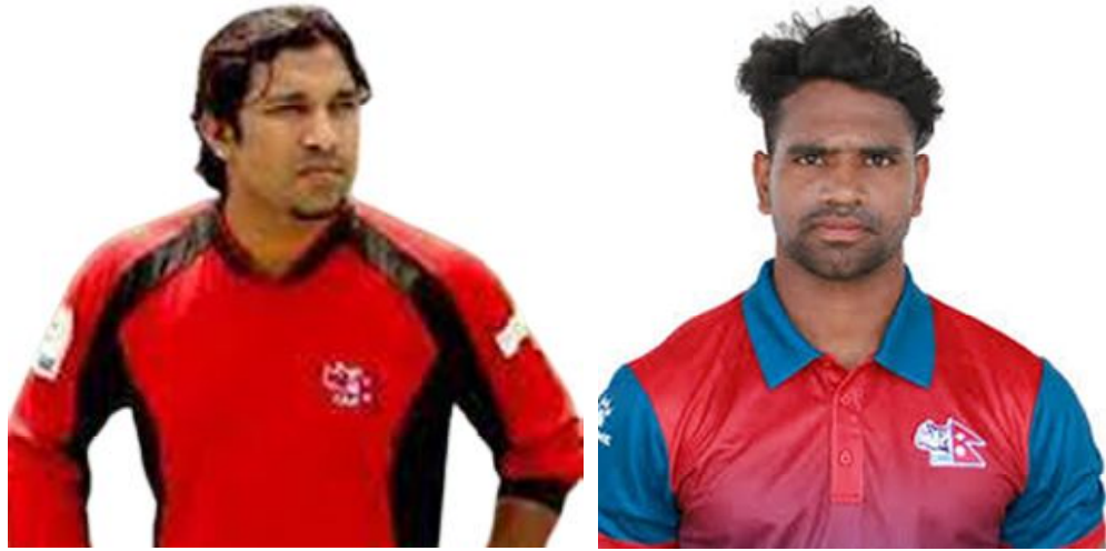
क्रिकेटर महबुब आलम