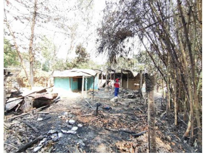
दैनिक समाचारदाता राजविराज, २९ चैत ।

सप्तरीको छिन्नमस्ता गाउँपालिका ३ सखडमा मंगलवार साँझ भएको आगलागीमा ९ वटा घर जलेर नष्ट हुँदा १६ लाख मूल्य बराबरको क्षति भएको छ ।