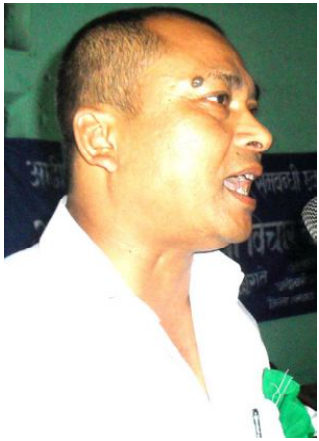
दैनिक समाचारदाता राजविराज, २९ चैत ।

मधेश प्रदेश सुरक्षा समन्वय समितिका अध्यक्ष एवं गृह, सञ्चार