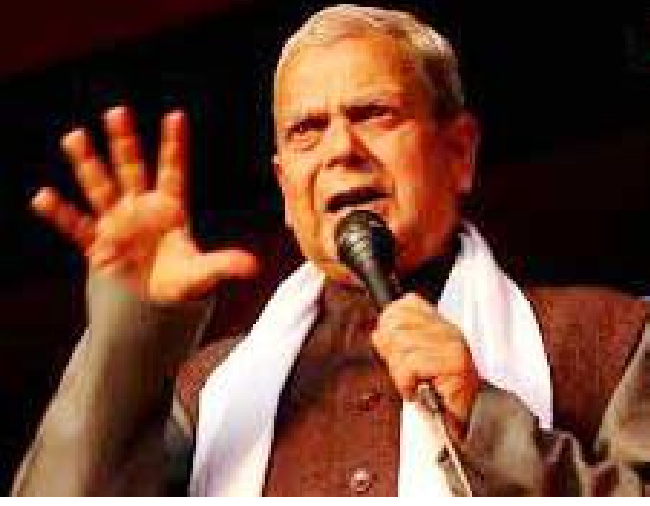
सिफारिस गरेको हो । त्यस्तै सोही बैठकले क्षेत्र नं.