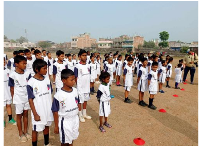
दैनिक समाचारदाता राजविराज, २३ पुस ।