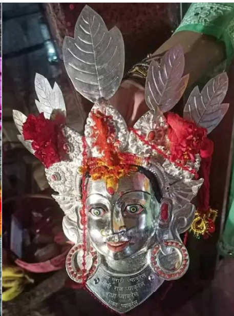
छिन्नमस्ता भगवतीको पुरानो मुकुट (बाँया) तथा दायोतर्फ नयाँ मुकुट।