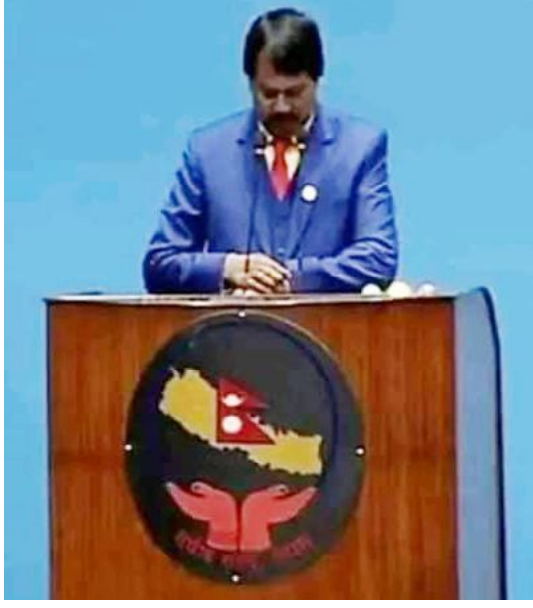
उनले राष्ट्रिय सहमति के का लागि हो भन्दै सदनमा

मौनधारण अघि उनले संसदलाई सम्बोधन गर्दै उनले नेपाली कांग्रेसतिर लक्षित गर्दै मधेशी र थारुलाई भित्तामा धकेलेर राष्ट्रिय सहमतिको कुराको अर्थ नरहेको उल्लेख गरे । मधेशीलाई साइड लगाएर हुने राष्ट्रिय सहमति कस्तो हुन्छ ?, उनले भने, हामी दलभन्दा माथि उठ्छौं तर तपाईंहरु वर्गीय संकिर्णताबाट माथि उठ्ने कि नउठ्ने ? देशलाई संकटबाट बाहिर लैजान राष्ट्रिय सहमतिको आवश्यकता रहेको बताए ।