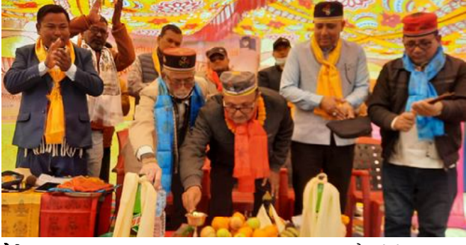
दैनिक समाचारदाता राजविराज, ८ माघ ।

सप्तरीमा पनि तामाङ समुदायले २८५९ औं सोनाम ल्होछार पर्व आइतबार मनाएका छन् ।