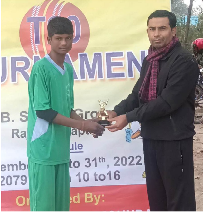
दैनिक समाचारदाता राजविराज, १२ पुस ।

क्रिकेट विकास प्रतिष्ठानद्वारा संचालित डब्लु राउन्ड रोबिनको आधारमा खेलाईएको अन्तरविधालय टि ट्वान्टी क्रिकेट प्रतियोगिता अन्तर्गतको मंगलबारको खेलमा प्रतिष्ठानले १ सय २५ रनको फराकिलो जित हात पारेको छ ।