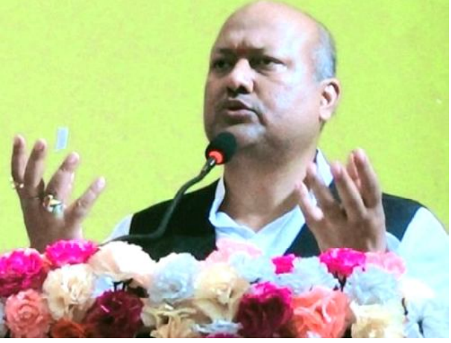
भारतबाट सामान ल्याउन समस्या भइरहेको छ । करको

दैनिक समाचारदाता जनकपुरधाम, १३ साउन । मधेश प्रदेशका मुख्यमन्त्री सतिशकुमार सिंहले उद्योगी व्यवसायीका समस्याप्रति प्रदेश सरकार गम्भीर रहेको बताएका छन् ।