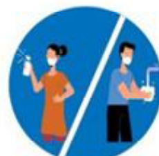
बेलाबेलामा साबुनपानीले हात धोउनु

अनुरोधकर्ता : राजगढ गाउँ कार्यपालिकाको कार्यालय सप्तरी