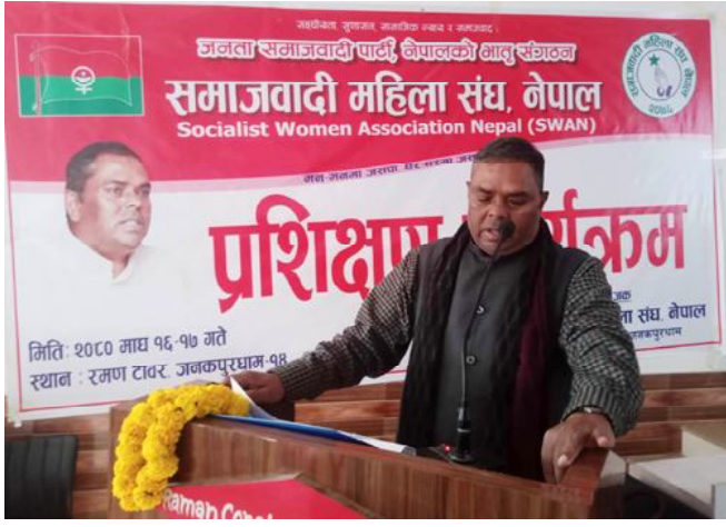
दैनिक समाचारदाता जनकपुरधाम, १६ माघ ।

जनता समाजवादी पार्टी नेपालका अध्यक्ष उपेन्द्र यादवले शासक वर्गको उपेक्षा र विभेदकारी नीतिले गर्दा मधेश पछि परेको आरोप लगाएका छन् ।