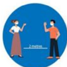
भौतिक दुरी कायम गर्नु