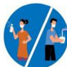
बेलाबेलामा साबुनपानीले हात धोउनु

अनुरोधकर्ता : तिलाठी कोइलाडी गाउँ कार्यपालिकाको कार्यालय सप्तरी