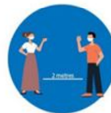
भौतिक दुरी कायम गर्नु