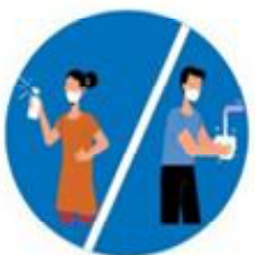
बेलाबेलामा साबुनपानीले हात धोउनु

अनुरोधकर्ता : तिलाठी कोइलाडी गाउँ कार्यपालिकाको कार्यालय सप्तरी