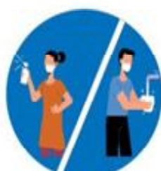
बेलाबेलामा साबुनपानीले हात धोऔं