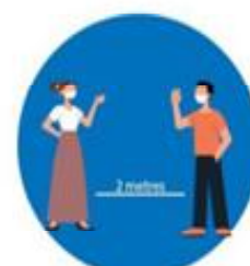
भौतिक दूरी कायम गर्ौं