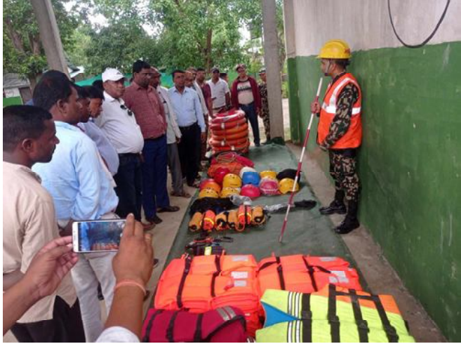
अधिकृत, सेना लगायत विभिन्न बाँकी अन्तिम पृष्ठमा