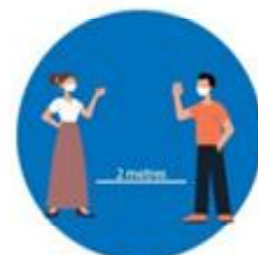
भौतिक दूरी कायम गर्नु