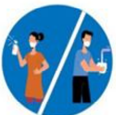
बेलाबेलामा साबुनपानीले हात धोउनु

अनुरोधकर्ता : राजगढ गाउँ कार्यपालिकाको कार्यालय सप्तरी