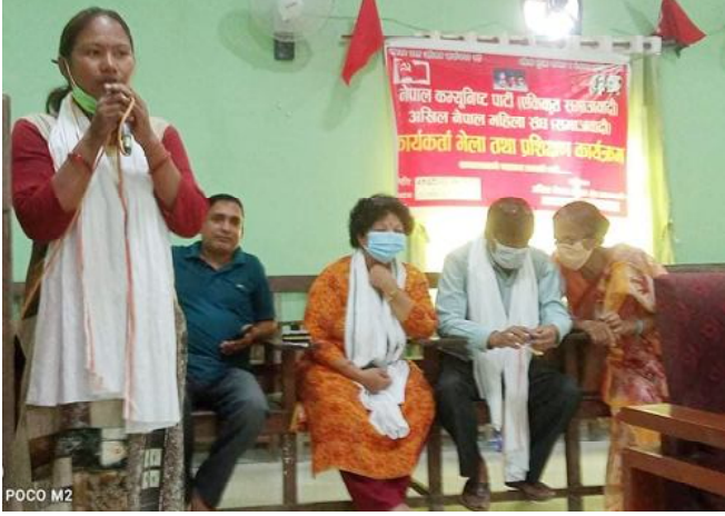
दैनिक समाचारदाता राजविराज, २७ भदौ । नेकपा एकीकृत समाजवादी