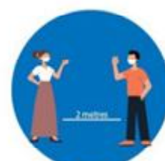
भौतिक दुरी कायम गर्नु