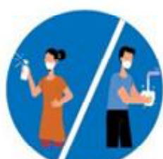
बेलाबेलामा साबुनपानीले हात धोउनु

अनुरोधकर्ता : तिलाठी कोइलाडी गाउँ कार्यपालिकाको कार्यालय सप्तरी