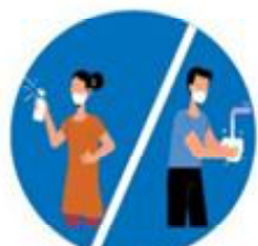
बताबतामा साबुनपानीले हात धोउनु

अनुरोधकर्ता : तिलाठी कोइलाडी गाउँ कार्यपालिकाको कार्यालय सप्तरी