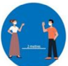
भौतिक दुरी कायम गर्नु