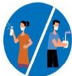
बेलाबेलामा साबुनपानीले हात धोउनु

अनुरोधकर्ता : राजगढ गाउँ कार्यपालिकाको कार्यालय सप्तरी