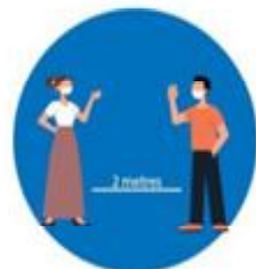
भौतिक दुरी कायम गर्नु